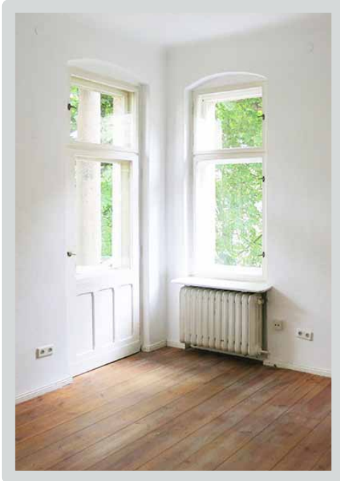
▶ Wohnzimmer mit Balkon*