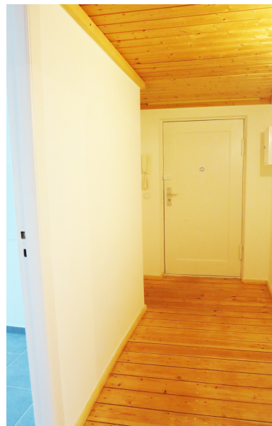
Flur mit Hängeboden