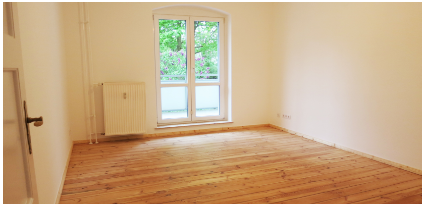
Wohnzimmer mit Balkon

Charmante Hochparterre-Wohnung in Köpenick